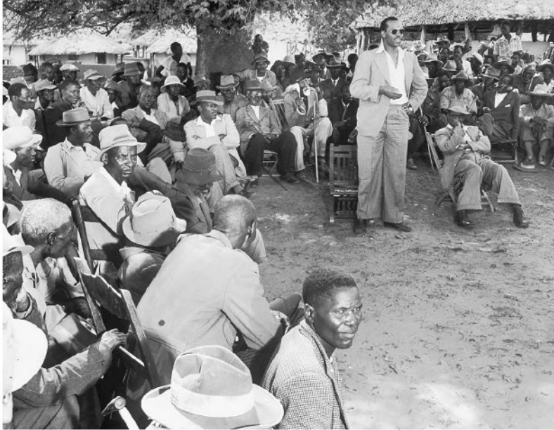
Рисунок 5. Серетсе Кхама обращается к суду племени в Серове, 1949 г.

Соединенного Королевства, а теперь, по причине этого брака, бывшая сотрудница Лондонского Ллойда 1 . Ее уволили сразу после того, как общественность узнала о ее замужестве [2].